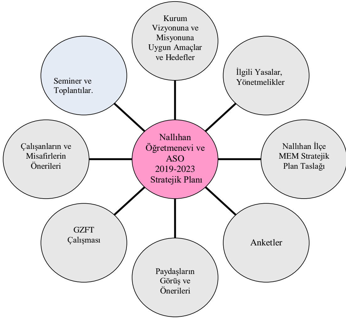
Şekil 1- Süreç Diyagramı

Nallıhan Öğretmenevi ve Akşam Sanat Okulu 2019-2023 Dönemi Stratejik Plan hazırlama süreci şu şekilde olmuştur: