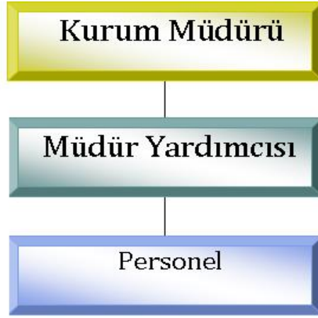
Tablo 4: Organizasyon ve Haberleşme Şeması